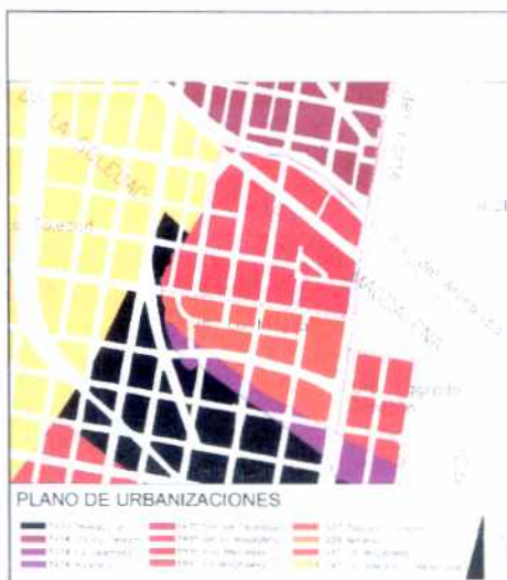
PLANO DE URBANIZACIONES

La circuntancia de no quedar sobre vias arterias oriente-occidente, pudo haber sido la causa de su excepcional conservación. Las áreas verdes de antejardines y calles ofrecen, junto con la escala de sus viviendas de dos pisos un panorama urbano singular.