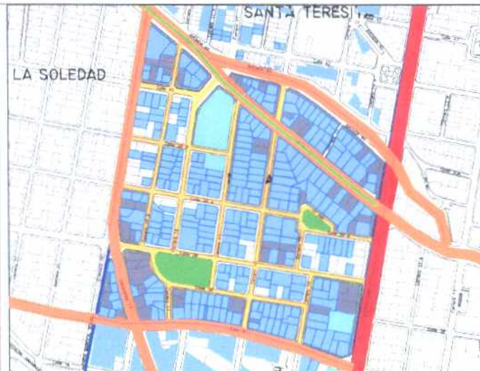
Inmuebles de Interés Cultural - MORFOLOGÍA EN PLANTA